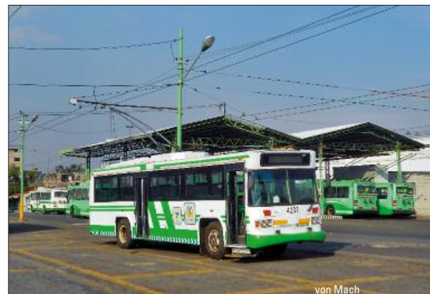
Öffentlicher Verkehr in Mexiko-Stadt – Seite 40