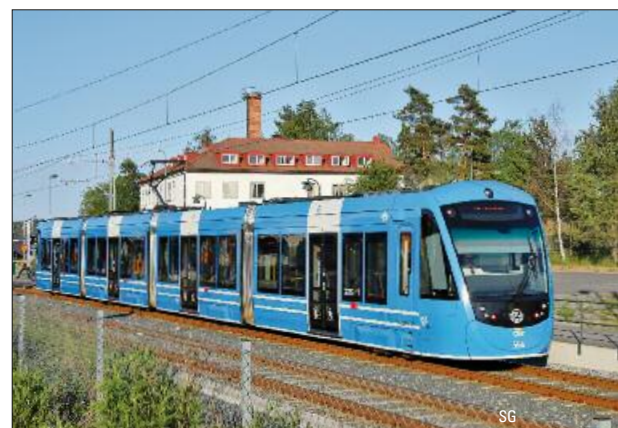
Zwischen zwei UITP-Gipfeln: ÖPNV in Stockholm – Seite 30