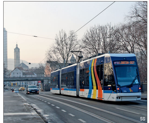
Jena baut die Tram aus – ab Seite 10