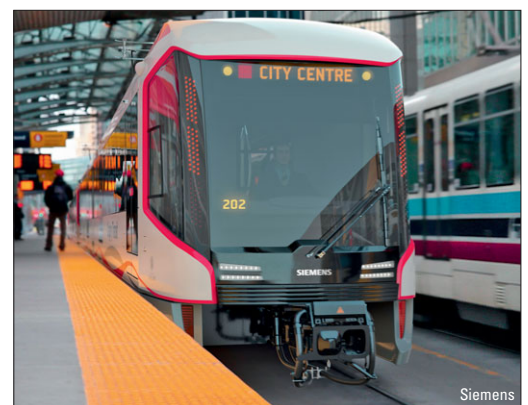
Aktuelle Kurzmeldungen – ab Seite 50