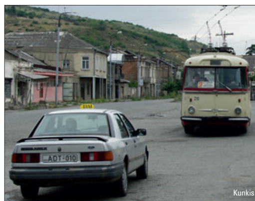
Stadtverkehr in Georgien heute – ab Seite 29

Wir wünschen unseren Leserinnen und Lesern ein schönes Weihnachtsfest und einen guten Start ins Neue Jahr!