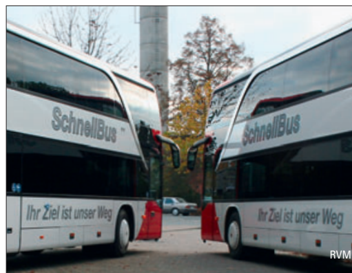
Regionalverkehr Münsterland modernisiert – ab Seite 26

Wir wünschen unseren Leserinnen und Lesern ein schönes Weihnachtsfest und einen guten Start ins Neue Jahr!