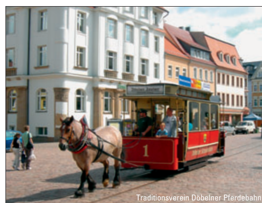
Döbelns Pferdestraßenbahn wiederbelebt – ab Seite 39